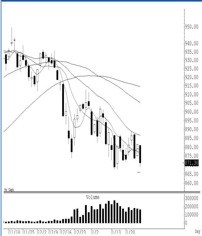
S50H25 (Close 871.30 Chg -10.20)

ยังไม่มีจุดต่ำใหม่ แต่ถ้าปิดต่ำกว่า 865 จุด แนวโน้มจะปรับตัวลงต่อสั้น ๆ ดีดกลับไม่ข้าม 877 จุด แนะนำ trading ในกรอบระหว่าง 877-866 จุด รับรู้กำไร